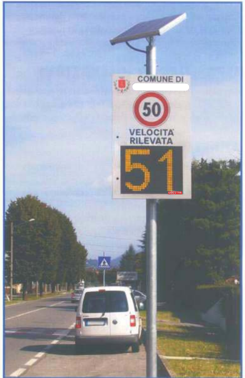
VERSIONE CON PALO CENTRALE